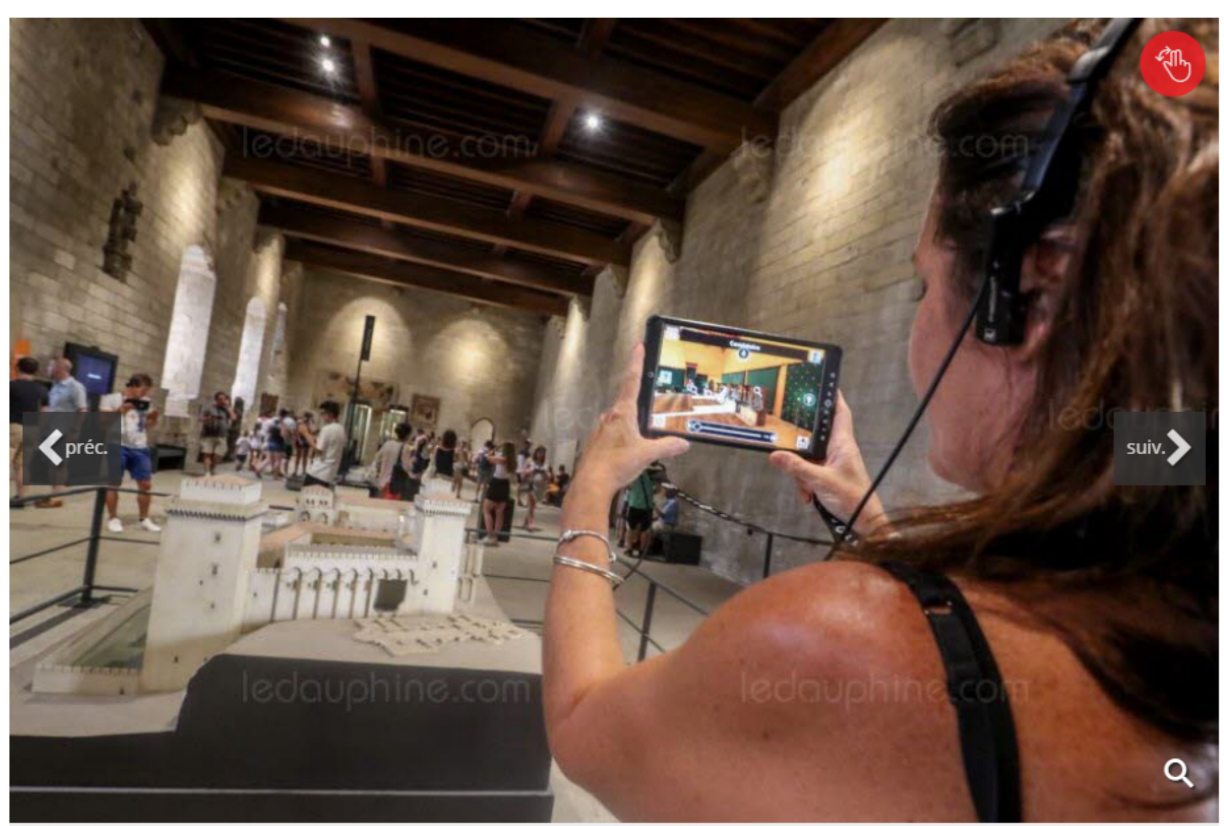
L'HistoPad permet de découvrir le palais des Papes tel qu'il était au Moyen Âge.