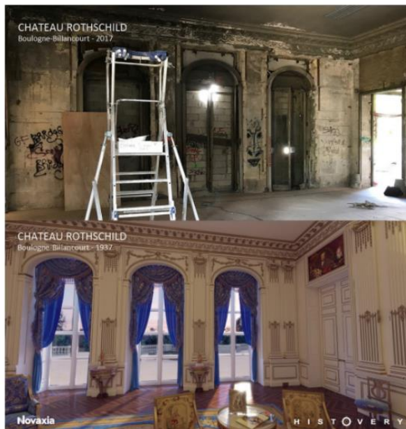
A Boulogne-Billancourt, la tablette de réalité augmentée redonne à la salle de réception du château de Rothschild, en ruine, son aspect en 1855.

Côté entreprises, la société immobilière Novaxia, qui a racheté l'an dernier le château de Rothschild (Boulogne-Billancourt), en ruines après trente ans d'abandon et un incendie, a de même choisi cette tablette pour reconstituer deux salles du château au temps de sa splendeur. Le château avait été construit en 1855 par James de Rothschild, fondateur de la branche française de la famille. En attendant de le rénover l'an prochain, Novaxia invite le public à revivre cette époque révolue. Il pourra visiter les lieux HistoPad en main cette fin de semaine aux horaires indiqués sur le site de la mairie, pour vivre l'expérience.